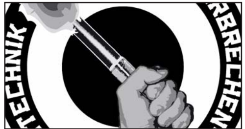
Bild in der Kurve ist für uns einfach ein Ausdruck der Fankultur und aus den Stadien dieser Welt nicht wegzudenken. Was in anderen Ländern allerdings reibungslos funktioniert und auch so gerne als „südländische Mentalität“ bezeichnet wird, wird bei uns immer mehr als Randalie und Gewaltakt abgestempelt.

So auch in unserem Nachbarland Österreich. Anfang dieses Jahres wurde dort ein neu verarbeitetes Pyrogesetz in Kraft gesetzt. Die Gesetze sowie die Strafen bei Missachtung sind erheblich verschärft worden. Die aktive Fankultur wurde bei dieser Maßnahme allerdings vollkommen außer Acht gelassen, ebenso die Verantwortlichen der Vereine. Das Innenministerium entschied, dass ein zu hohes Gefahrenpotenzial bei pyrotechnischen Aktionen bestehe. Klar ist, dass man ein gewisses Risiko niemals ganz ausschließen kann, allerdings hat sich schon oft genug gezeigt, dass der verantwortungsvolle Einsatz von Pyro völlig ungefährlich ist. Zudem muss Pyrotechnik, vor allem von den Medien, endlich als Ausdruck der Emotionen und nicht als aggressives oder gewaltbereites Verhalten angesehen werden.